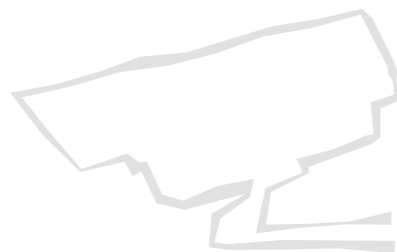
Таблица основных характеристик уличных черно-белых телекамер UNICAM